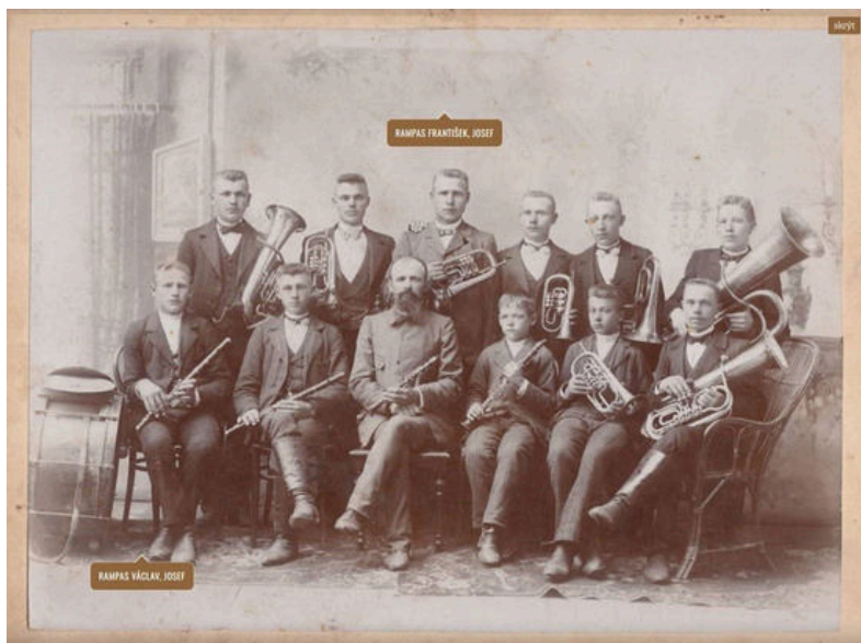
Kapela z Hrušvic, odhadem roku 1860. Zdroj: Archiv Jaroslav Urban, Inventární číslo: IV013026

Vše kolem mého zájmu o příběh předků začalo záměrem vydat znovu tiskem Historickou mapu českého osídlení na Volyni. A tady jsem narazil na problém s tiskovými podklady mapy.