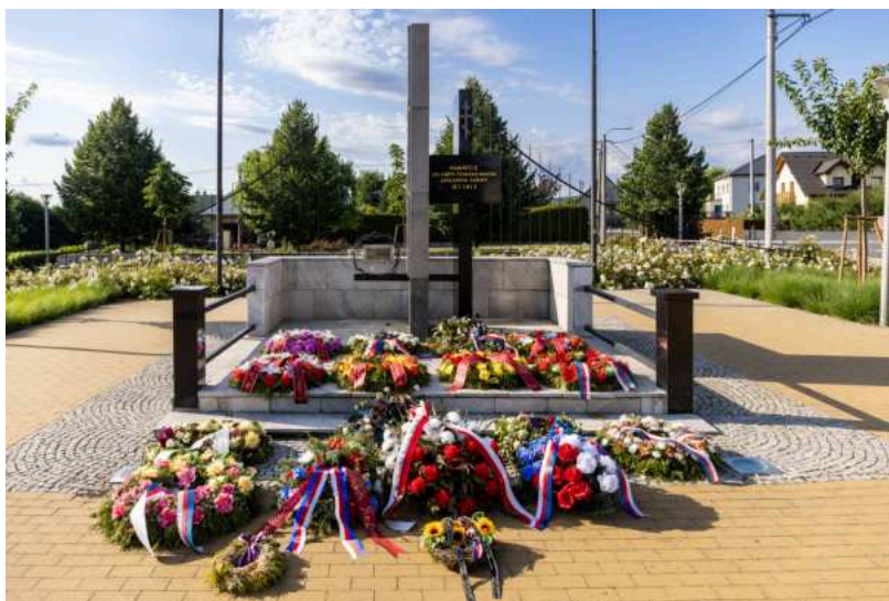
Pieta v Novém Malíně, foto: Libor Haša