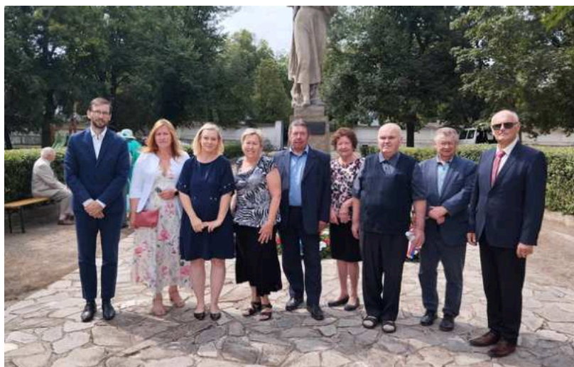
Společná fotografie po slavnostním aktu v Žatci